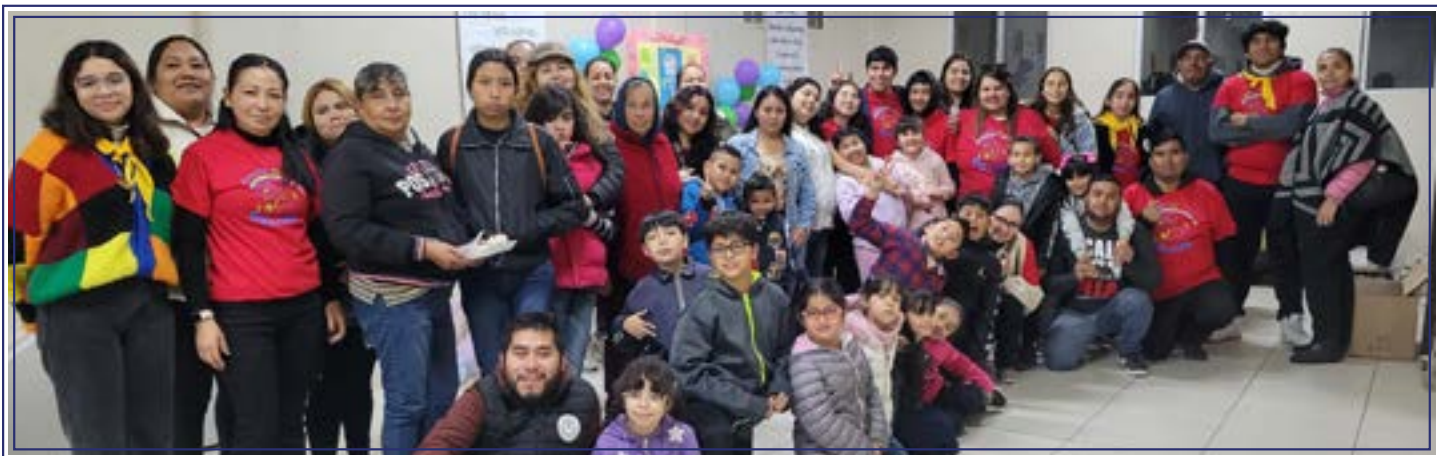
Nos llena de esperanza servir a los más pequeños del Señor.

Hace unos meses tuve la oportunidad de asistir a un congreso muy enriquecedor que giró en torno a la celebración del Jubileo 2025 , la profundización en la liturgia y la centralidad de la Iglesia como cuerpo de Cristo. Desde el momento en que ingresé al recinto, sentí un ambiente de entusiasmo y deseo de compartir conocimiento ; las conferencias estaban cargadas de reflexiones profundas pero expuestas con un lenguaje cercano, lo cual facilitaba mucho la comprensión de los temas. A continuación, compartiré lo que viví y aprendí en este encuentro, donde se abordaron cinco ejes principales: el significado del Jubileo 2025 y sus implicaciones, la formación litúrgica, la celebración de la muerte y resurrección de Cristo, el culto cristiano a Dios y la liturgia como celebración de la Iglesia.