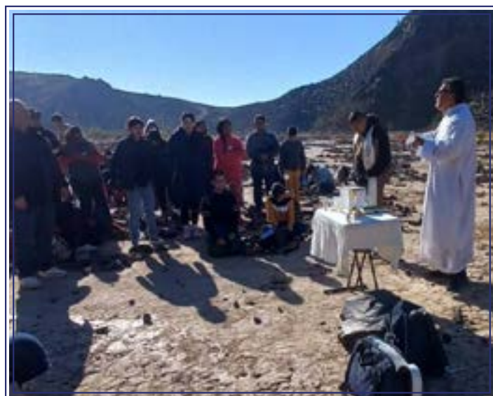
Hay muchas formas de tener una fe viva y compartirla en comunidad; Dios está presente en toda su creación.

Asimismo, el culto cristiano tiene una fuerte dimensión comunitaria: lo que vivimos el domingo en la Santa Misa no es "algo privado" entre cada persona y Dios, sino la celebración en la que toda la Iglesia se une a Cristo para alabar al Padre . De ahí que la participación plena, consciente y activa sea uno de los pilares que el Concilio Vaticano II tanto promovió.