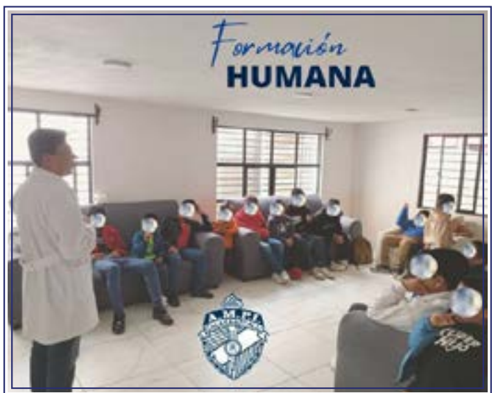
Para una sociedad justa, debemos dar una formación humana.