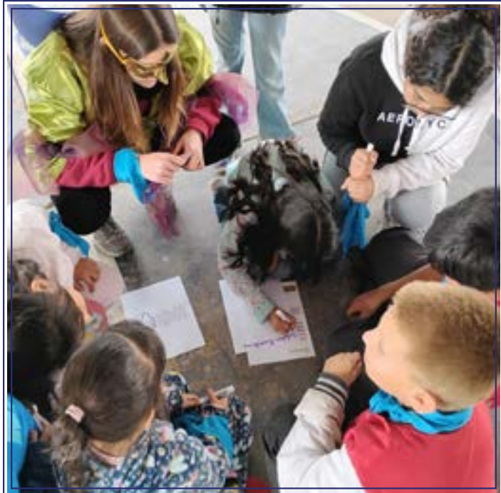
Los niños conocen bien la alegría de un nuevo comienzo, aprendamos de ellos.

Este Jubileo 2025 lleva por lema “Peregrinos de Esperanza” , recordándonos que todos estamos en camino, con la mirada puesta en la misericordia de Dios y en la posibilidad de recomenzar. Mencionaron el documento pontificio Spes non confundit (“La esperanza no defrauda”, tomado de Romanos 5,5), subrayando que la Iglesia desea que este sea un momento de peregrinación interior y exterior , para reencontrarnos con la dimensión comunitaria de nuestra fe.