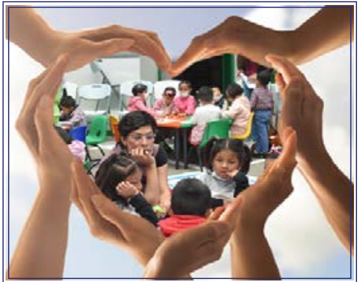
El amor construye infancias poderosas y felices.