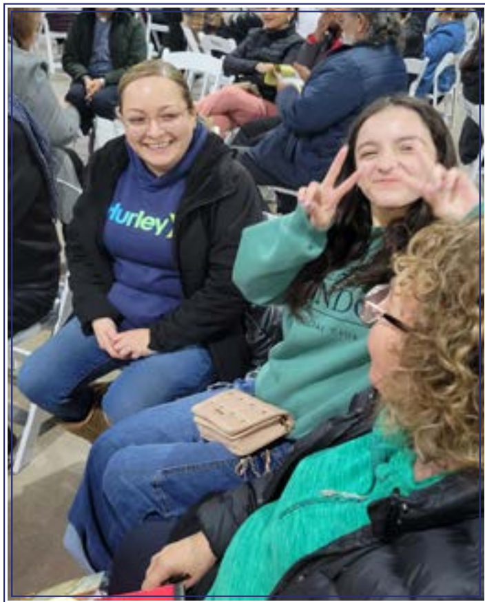
La perspectiva de los más jóvenes es esencial, ya que ellos construyen un vínculo con el mundo de hoy y el de mañana.

El querer seguir en esa barca junto con mis hermanos de comunidad, seguir “ echando las redes ” y que mediante ello, podemos llegar a la mejora, el seguir esa unión con todos y todas mediante lo mas importante que es la escucha activa ; preocuparnos por el hermano, apoyarnos los unos a los otros y no hacer de menos a los demás porque su servicio es diferente, al final, a quien le servimos es a un solo Dios, le servimos a Él y no solo a los demás ; a veces nos preocupa el qué dirán de nuestro servicio. Cada servicio es de suma importancia y más el que pueda llegar al punto de atraer a más personas a la parroquia y se unan al equipo.