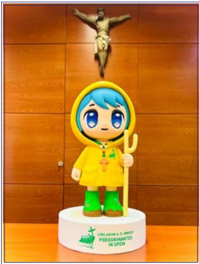
"Luce" es el personaje que representa el mensaje del Jubileo 2025, itodo su diseño transmite esperanza!