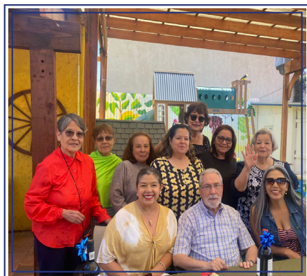
Primer "Desayuno Solidario" en Ensenada, B.C.