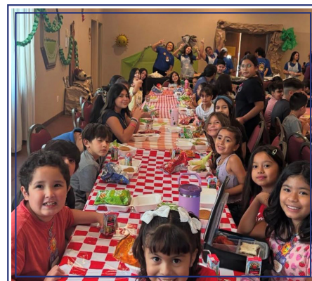
Calix-Verano 2025, Calexico CA.