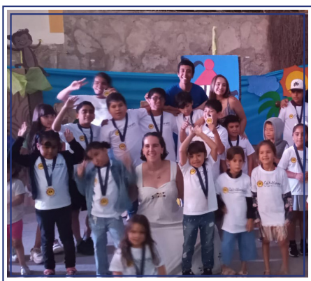
Bufaverano 2025, Ensenada, B.C.