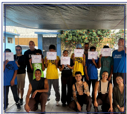
Visita de Lux Boreal a HOCATl, evento de danza.