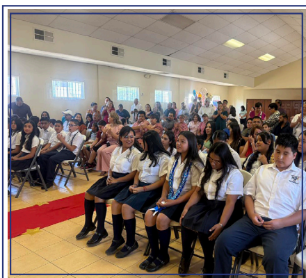
Graduaciones del IJC 2024 - 2025, Mexicali, B.C.