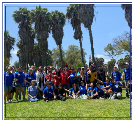
Verano Feliz 2025, Tijuana, B.C.