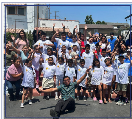
Verano EstelAr 2025, Los Angeles CA.