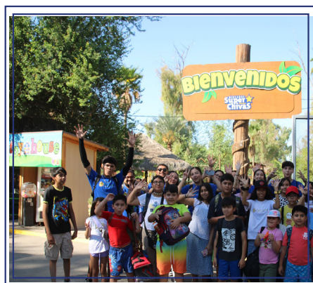
Cachiverano 2025, Mexicali, B.C.